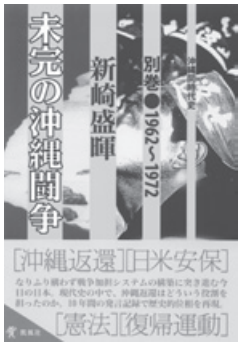
ISBN978-4-7736-2902-6 四六判 544頁 定価 3800円＋税

【沖】縄密約問題の本質はそこにある。解決するには、この仕組みそのものを壊すしかない。